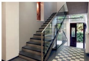
168 Sanierung Foyer VHS Merzig 2014 Gutenbergstraße 14, 66663 Merzig Architektin/Innenarchitektin a hoch i netzwerk, Lisa Groß und Sabine Waschbüsch, Dillingen Bauherrin Volkshochschule im Landkreis Merzig-Wadern e.V. Besichtigung Sa 14 - 16 Uhr