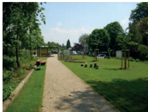
162 Tor zur Biosphäre am Bahnhofspunkt 2013 Raiffeisenstraße, 66424 Homburg-Einöd Landschaftsarchitekt Peter Glaser, Homburg Bauherrin Kreis- und Universitätsstadt, Homburg Besichtigung jederzeit möglich (öffentlich zugänglich) Führung Sa 11.30 Uhr