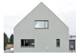
170 Wohnhaus Zum alten Schwimmbad 2014 Zum alten Schwimmbad 3, 66346 Püttlingen Architekten FLO-SUNDK architektur+urbanistik GmbH, D. Flor, J. Stahnke, M. Krämer, Saarbrücken Mitarbeiterin T. Eickhoff Bauherrin Familie Frank Führungen So 14 und 15 Uhr