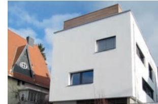
172 Neubau Einfamilienhaus 2014 Petersbergstraße 75a, 66119 Saarbrücken Architekten wack + marx, St. Ingbert Mitarbeiterin T. Pfeffer Bauherren R. Erdkönig + D. Bauer Besichtigung Sa 14 - 17 Uhr