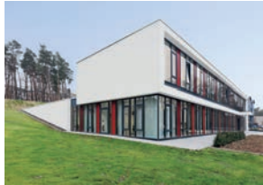
160 Strahlentherapie am UKS 2013 Universitätsklinikum des Saarlandes, Geb. 6.5, 66424 Homburg Architekten Ludes Architekten, Recklinghausen Landschaftsarchitekt Peter Glaser, Homburg Bauherr : Saarland, LZD Besichtigung Sa 13 - 14 Uhr Führung 13.00 Uhr