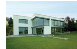
180 Neubau Einfamilienhaus 2013 Karlstraße 140, 66127 Saarbrücken-Klarenthal Architekten Prof. Rollmann + Partner, Homburg Bauherrin Familie Kunkel Besichtigung Sa 10 - 14 Uhr