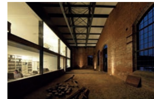
178 Bauwaggon Federnschmiede (Tor 38) 2014 Saar-Lor-Lux-Straße 17 A, 66115 Saarbrücken-Burbach Architekten BRÜNJES ARCHITEKTEN Oliver Brünjes – Architekt AKS/BDA, Saarbrücken Bauherrin Vera Burbach-Brünjes, Innenarchitektin AKS/BDA Führungen Sa 12 und 13 Uhr