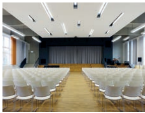
158 Umbau der Aula des Saarpfalz-Gymnasiums 2014 Untere Allee 75, 66424 Homburg Architektin/Innenarchitektin a hoch i netzwerk, Lisa Groß und Sabine Waschbüsch, Dillingen Bauherr Saarpfalz-Kreis, Homburg Besichtigung So 14 - 16 Uhr Foto Sabine Waschbüsch

Programm bundesweit: www.tag-der-architektur.de