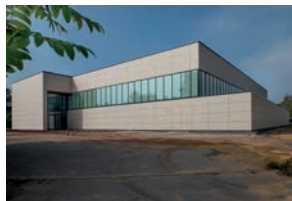
164 Sporthalle Sandrennbahn 2014 Cranachstraße 7, 66424 Homburg-Erbach Architekt Mario Morschett, Gersheim Bauherr : Interkommunales Projekt Saarpfalz-Kreis und Stadt Homburg Besichtigung Sa 10 - 16 Uhr Führungen Sa nach Bedarf